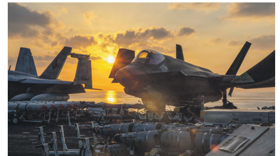
מתקפה משולבת ומוחצת. מטוס F-35 של חיל הנחתים האמריקני על סיפון נושאת המטוסים לינקולן

שאלת הסיים: התקיפה כבר יצאה לדרך, וכעת כולם מחפשים תשובה לשאלה הבאה