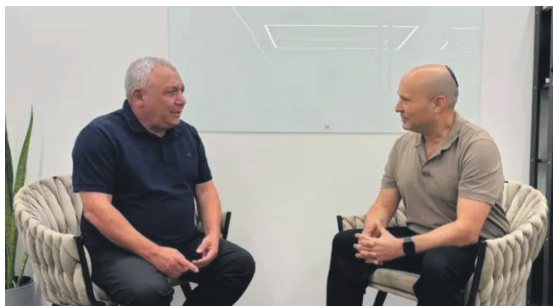
"החלופות הביטחוניות" נראות תלושות ורחוקות מסדר היום. בנט ואיזנקוט

המנה הראשונה: סדר היום הביטחוני מציב את נתניהו במרכז דוחק את בנט ואיזנקוט