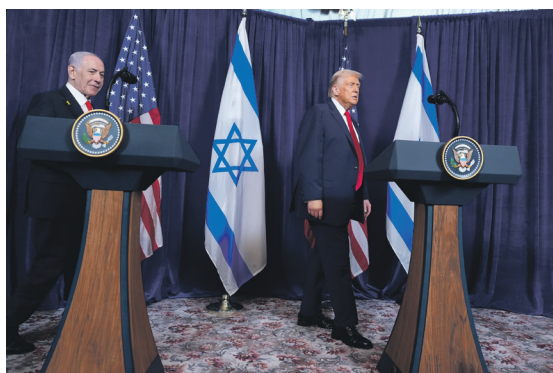
הפגישה השביעית הייתה החשובה והמכריעה יותר מכל האחרות. טראמפ ונתניהו

כך הפכה סערת החנינה לתרגיל הטעיה מתוחכם שהסתיר את ההכנות למתקפה באיראן