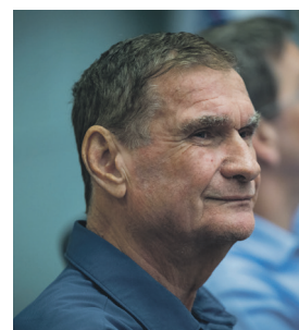
קול שונה ותומך. חיים רמון

בעוד פעילי מחאה ממשיכים לתקוף, יש גם יריבים פוליטיים שמוכנים לפרגן בחצי פה