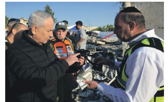
אסון מחריד בבית שמש. נתניהו ורה"ע הרב גרינברג עם התפילין שנתורו ביזה

שאגת המנדט: במחנה הרל"ב חוששים שהחיסולים יהפכו לסיסמת הבחירות של נתניהו